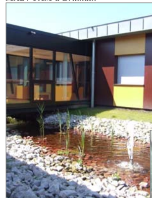
MAS / FAM à Brumath