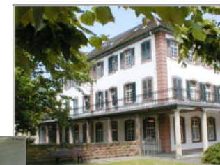
Pavillon Pensionnat à Brumath