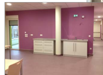
Ateliers Thérapeutiques Centre de Santé Mentale Strasbourg Eurométropole Ouest