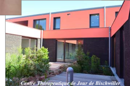
Centre Thérapeutique de Jour de Bischwiller